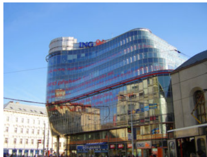
Edificio Zlaty Andel

Propondremos una visita a los proyectos de Ricardo Bofill en el barrio de Karlín, reconstruido tras las inundaciones de 2002, recorreremos el también nuevo barrio de Smichov con el edificio Zlaty Andel de Jean Nouvel.