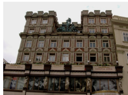
Palacio de Adria