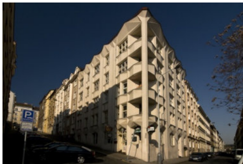
casas cubistas de Vysehrad

Visitaremos las casas cubistas de Vysehrad, El Palacio Adria, Banco de los Legionarios CSOB de y El Museo del Cubismo Checo. Ubicado en la Cubista Casa de la Madre Negra de Dios. Alberga una nueva exposición permanente de la Nacional de Praga que abarca el tema del cubismo checo en su totalidad. Posibilidad terminar tomando un café en el Café Cubista de la calle Celetna.