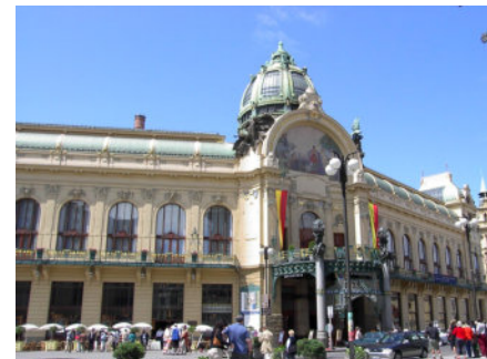
la Casa Municipal (Obecni Dum)